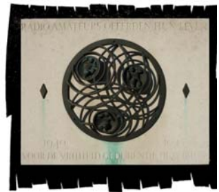
Het door de beeldhouwer H. J. J. Danneburg ontworpen gedenkteken symboliseert de in het verborgen werkende radio operators (drie kleine figuurtjes), die met elkaar in contact staan d.m.v. radio-golven (de cirkelsegmenten).

Nadat de heer Neher — juist een maand tevoren was hij door de regering van de V.S. van Noord-Amerika onderscheiden met de „Medal of Freedom” in goud, wegens zijn voortreffelijk optreden in de vrijheidsstrijd — zijn treffende herdenkingsrede had uitgesproken, onthulde hij de gedenksteen, welke was ingemetseld in